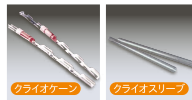
バイアルは付属していません。