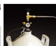
使用可能な圧力になるまでには数時間かかります。サーモ5には使用できません。