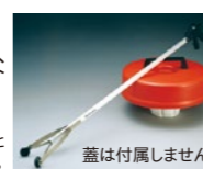
バイオケン20には使用できません。先端のゴムは液体窒素に浸けると劣化するため、液体窒素を取り出してからの使用をお勧めいたします。蓋は付属しません。