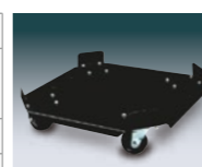
高さ: 約13cm。ストッパー機能はございません。