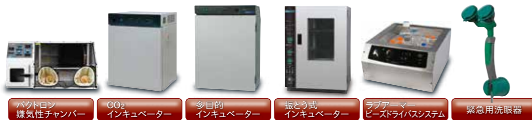
バクトロン嫌気性チャンバー CO 2 インキュベーター 多目的インキュベーター 振とう式インキュベーター ラブアーマービーストライバシステム 緊急用洗眼器

仕様・デザイン・価格変更および生産中止等、予告なく実施される場合がございます。納品までに期間を要する場合もございます。掲載の数値等は基準値につき、ご使用条件により異なる場合があります。あくまでも選定の目安としてご覧ください。各種研究に応じて安全に関する知識および経験を有する指導者のもとでご使用ください。ご使用前には目視等で破損等の異常の有無を確認し、テスト・点検を行い安全を確認した上でご使用ください。不良・破損等によって誘発される二次的損失については対応いたしかねます。予めご理解のほどお願いします。研究用のため医療・動物実験等には使用できません。印刷物のため、実物と色が多少異なる場合がございます。価格はすべて税抜です。