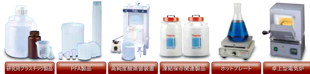
研究用プラスチック製品 PFA製品 高純度酸蒸留装置 凍結保存関連製品 ホットプレート 卓上型電気炉

東栄では各種理化学関連製品を取り扱っています。 カタログご希望・お問い合わせなど、お気軽にご相談ください。