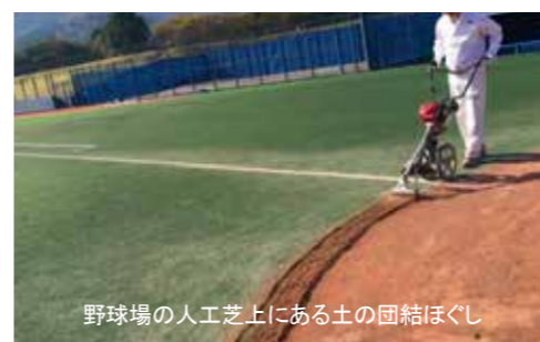
野球場の人工芝上にある土の団結ほぐし