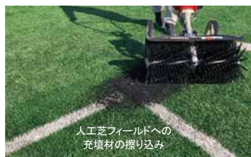
人工芝フィールドへの 充填材の擦り込み