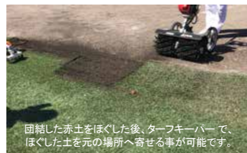
団結した赤土をほぐした後、ターフキーパーで、 ほぐした土を元の場所へ寄せる事が可能です。