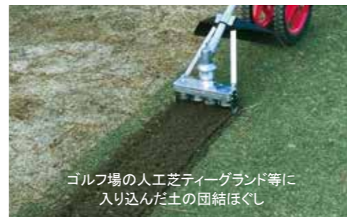
ゴルフ場の人工芝ティーグラウンド等に 入り込んだ土の団結ほぐし