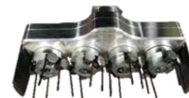
計16本のピンが回転し、 効率よく団結した土をほぐします。