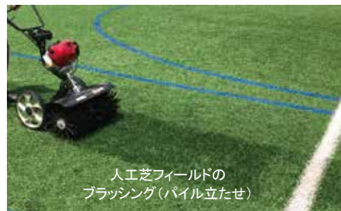
人工芝フィールドの ブラッシング(パイル立たせ)