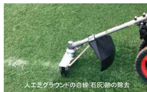
人工芝グラウンドの白線(石灰)跡の除去