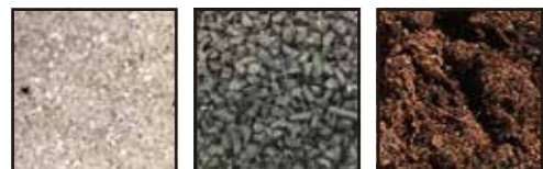
けい砂 ゴムチップ 天然素材充填材